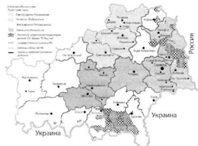
Рис. 2. Туристско-рекреационные зоны Гомельской области

В Добрушском, Чечерском, Ветковском районах целесообразно развитие экскурсионной деятельности. Октябрьский, Кормянский, Буда-Кошелевский, Лоевский, Ельский, Наровлянский, Хойникский, Брагинский районы не имеют выраженного направления или не пригодны для массового туризма.