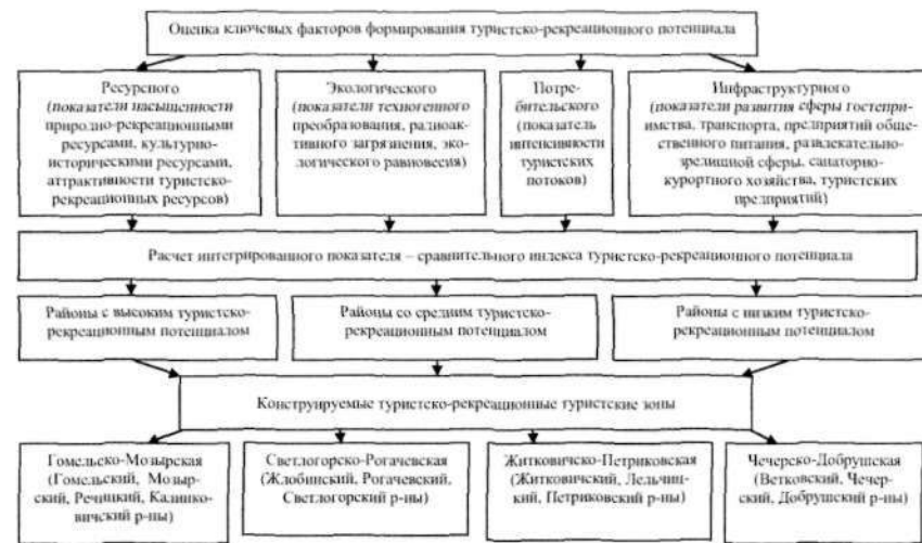
Рис. 3. Алгоритм оценки туристско-рекреационного потенциала Гомельской области

экологического фактора > 0 ; значения сравнительного индекса ТРП); отчет (высокие значения ( > среднего) сравнительного индекса ТРП).