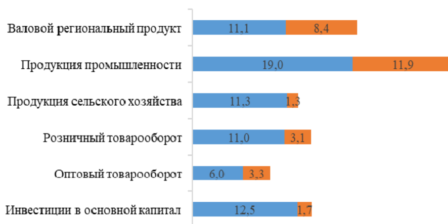
Рис. 1. Экономика региона в 2024 г.:

■ – доля в Республике Беларусь, %; ■ – объем, млрд долл. США