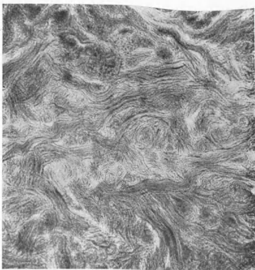
Рис. 2. Микрофотография кожи, выдубленной в течение 18 час. при одновременном воздействии ультразвука; \times 30