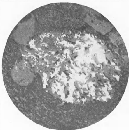
Рис. 4. Рудное окатанное зерно с галенитом, халькопиритом (белое) и мелкими кристалликами альбита (серое) в безрудной алевропелитовой гальке (черное). Снято в отраженном свете, \times 92