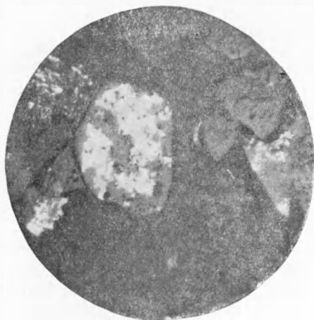
Рис. 3. Рудные зерна с галенитом и халькопиритом (белое), вдавленное в безрудную алевропелитовую гальку (черное). Снято в отраженном свете, \times 62