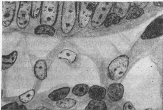
Рис. 2. Ретикулярные клетки стромы ворсинки. Ценкер-формол, азур-эозин. \times 1300

Оседлые клетки в собственной оболочке кишки неоднократно описывались в литературе. А. Максимов (6) считает их близкими по свойствам к гистиоцитам; А. Заварзин (5) причисляет к особой клеточной разновидности — к ретикулярным клеткам. В строме ворсинок нам тоже удалось обнаружить оседлые клеточные элементы (рис. 2). Ядра этих клеток довольно крупные, большей частью бледно окрашены, округлой формы. Структура их типична для ядер клеток фибробластического ряда. Базофильная цитоплазма имеет отростчатый характер. Иногда можно видеть синцитиальные связи между клетками, однако, в отличие от ретикулярного синцития лимфатических узлов, связи эти в строме ворсинки не удается проследить на большом расстоянии. Создается впечатление, что имеется соответствие в расположении отростков клеток и поперечных аргирофильных волокон.