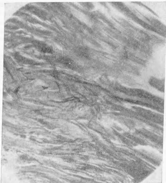
Рис. 2. Микрофото с препарата правой икроножной мышцы крысы № 585 на 108 день после денервации и 48 день после повреждения. Обработка по Бильшовскому. \times 68

останавливается и сменяется бурным процессом восстановления. Изучение функционального состояния мышц при этом показало, что при условии повреждения мышцы через 40—60 дней после ее денервации, спустя 30—40 дней после нанесения повреждения, во всех случаях обнаруживаются признаки восстановления функции, а через 2 мес. функция мыш-