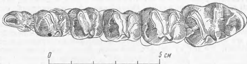
Рис. 3. Нижние коренные и ложнокоренные зубы Mongolotherium plantigradum

Д и а г н о з. Самый крупный представитель семейства Prodinocerati- dae. (Наибольшая длина черепа около 450 мм.) Череп с чрезвычайно сильно развитыми гребнями затылочным и сагиттальным, вследствие чего верхняя часть затылка очень сильно выступает назад и нависает над частью, прилегающей к foramen magnum. Мышечки сильно выдающиеся, направлены вниз. Диастема между верхними клыками и ложнокоренными большая: ее длина равна или больше задне-переднего диаметра верхнего клыка. Диастема между нижними клыками и ложнокоренными прибли- зительно вдвое больше задне-переднего диаметра нижнего клыка. Боль- шие предохранительные лопасти нижней челюсти хорошо обособлены*.