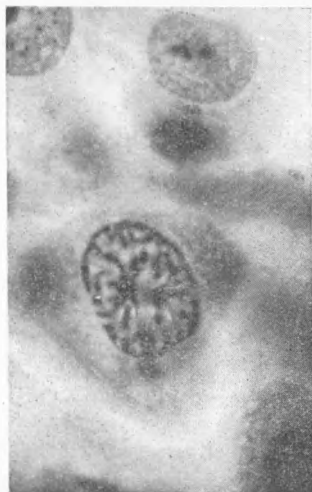
Рис. 1. Мезотелиальная клетка вступает в митоз. Тотальный препарат диафрагмальной брюшины. Окраска железным триоксигематейном. Микрофотограмма. Микр. МБИ-1, увел. 150 \times 5 (1,9)