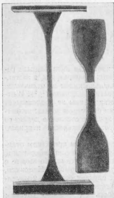
Рис. 1. Фотографии образца перед разрывом и после разрыва

ного напряжения, рассчитанного на начальное сечение. Быстрый разрыв (обр. 1) дает гладкую, зеркальную поверхность разрыва*, хорошо отражающую свет и напоминающую внешним видом шлиф металла с мелкозернистой структурой. Разрывы 5-минутный и более длительные образуют рельефную, покрытую линиями сколов зеркальную зону и обнаруживают существование шероховатой зоны разрыва, плохо отражающей свет.