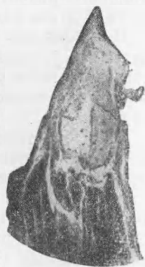
Рис. 2. Хрящевой скелет дополнительного пальцевидного выроста

В данной работе нас интересовал принципиальный вопрос о воз-