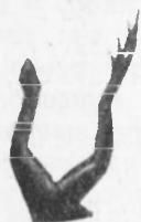
Рис. 4. Форма регенерата задней лапки у остромордой лягушки