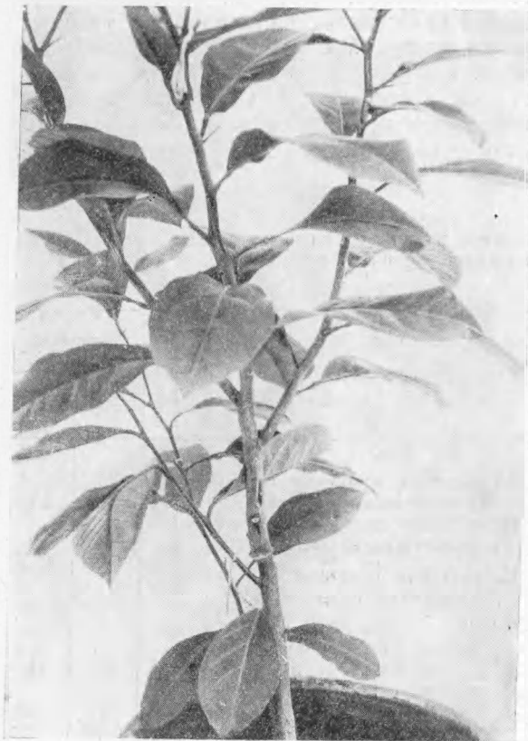
Рис. 2. Влияние кольцевого надреза на прорастание привитой почки и рост привоя у лимона. В нижней части стебля из привитой почки с кольцевым надрезом вырос побег (слева с ниткой), выше — привитая почка без кольцевого надреза не проросла (фото 25 VII 1951 г.)

Второй опыт с прививками был начат 3 VIII, когда на 65 сеянцах лимона Новогрузинского, Мейера и других были привиты почки с пло-