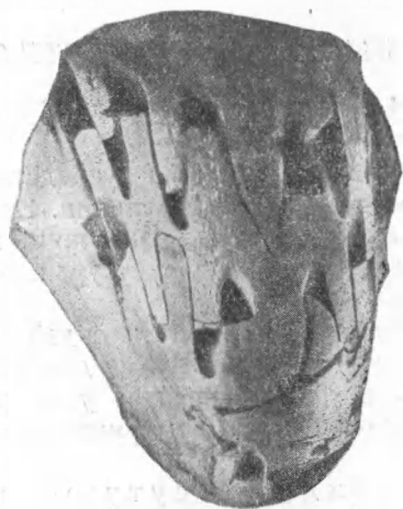
Рис. 1. Siberionutilus multilobatus sp. nov. Вид на вентральную сторону. \times 1/2

Раковина округлая или несколько уплощенная в вентральной зоне. Скульптура состоит из тонких радиальных ребер и штрихов между ними. Сифон центральный. Сутурная линия, кроме вентральной лопасти, имеет по 3—5 лопастей в боковых зонах. К роду могут быть отнесены только два вида: S. multilobatus sp. nov. и Siberionutilus angulatus sp. nov.