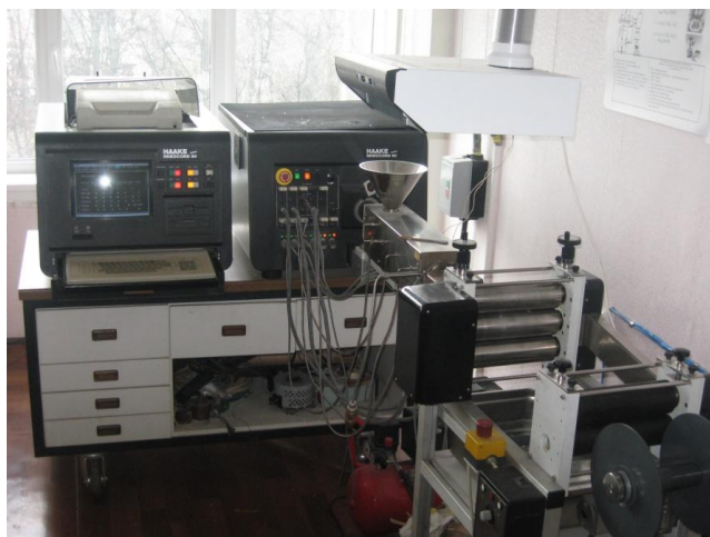
Рисунок 4 – Компьютеризированный экструзиограф «Rheocord 90» фирмы «НААКЕ» (ФРГ)

В полимерную матрицу на стадии загрузки полимера в компьютеризированный экструзиограф вводились различные навески (от 0,5 до 4,0 мас. %) антипирена разработанного состава. Была получена полимерная лента, механические параметры которой определялись по соответствующим методикам.