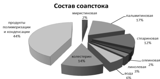
Рисунок 3 – Состав соапстока

ему необходимые свойства [4]. Так обработка гидрофобными органическими реагентами позволяет повысить сродство вещества антипирена к полимерным материалам, что является необходимым требованием совместимости. Нами впервые для этих целей применены соапстоки жирных кислот. Целесообразность использования последних обусловлена их липидной природой, обеспечивающей гидрофобность, а также наличием поверхностно-активных свойств, способствующих диспергированию [5].