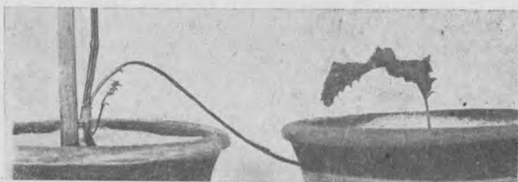
Фиг. 3. Цветение побега периллы на главном стебле в связи с влиянием короткого дня на отщепленный лист (1 IX 1938).

Во II группе растений, где отщеплялись листья, они подвергались воздействию искусственно укороченного дня, а на основном стебле растения все крупные листья были срезаны, и через каждые 3—5 дней производилась подрезка подрастающих листьев. У опытных растений отщеплен-