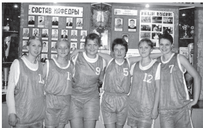
Сборная ГГТУ им. П. О. Сухого по баскетболу

Наверно, любой нынешний первокурсник считает, что 18 лет – это не так уже и много. Однако, когда дело касается не возраста, а периода времени, всё воспринимается совсем по-другому. Именно 18 лет, с 1988 года, в нашем родном политехе не проводились соревнования по баскетболу среди представительниц прекрасного пола. То ли девушек у нас не хватало, то ли времени у них не было, то ли сказался тот факт, что на весь наш могучий вуз работает лишь один тренер по баскетболу.