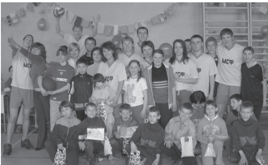
Студенты и воспитанники Улуковской школы-интерната