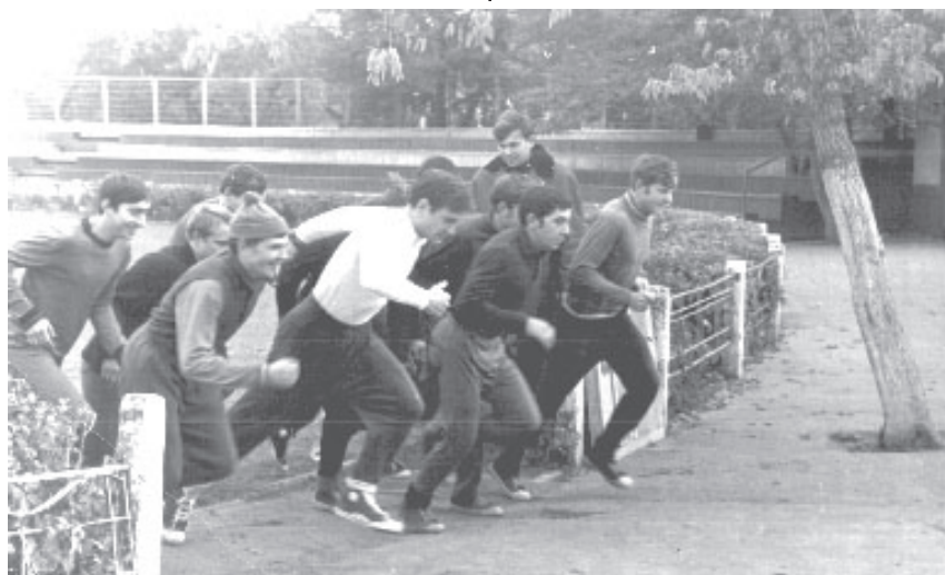
Первенство общетехнического факультета БПИ (1972 год)

Желаем всем счастливой жизни, крепкого здоровья и неисчерпаемой энергии, осуществления заветных целей и стремлений, поддержки друзей, личного благосостояния и душевного равновесия!