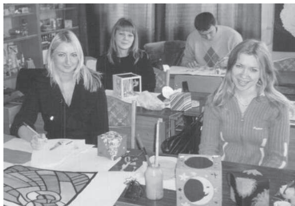
Лабораторные занятия по конструированию и дизайну упаковки (гр. Т-51)