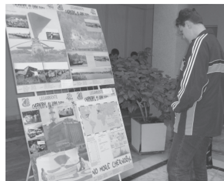
Фотоплакаты благотворительного объединения «Мэя»