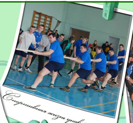
Спортивная жизнь университета