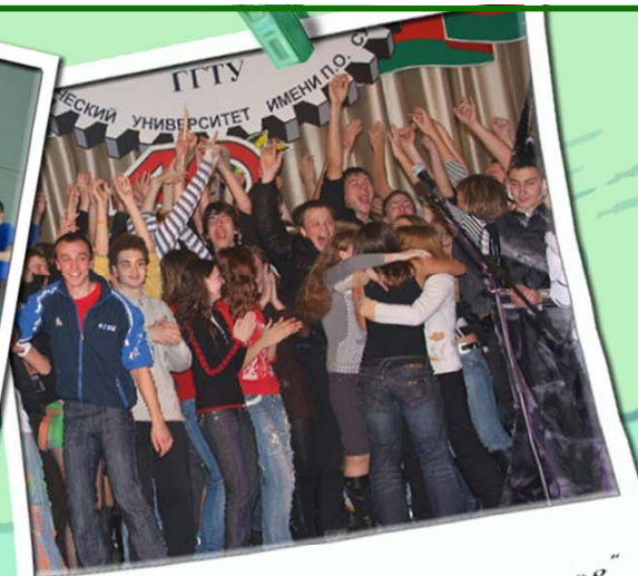
"А-ш - ка, первокурсник 2008"