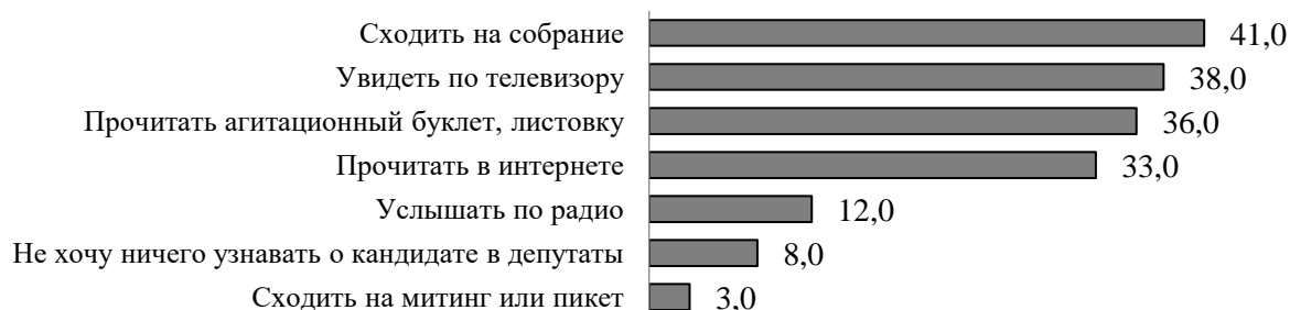
Рисунок 2. Распределение ответов на вопрос «Как бы Вы хотели узнать о кандидате в депутаты?», в %

Результаты социологических исследований [1; 2; 3; 4] свидетельствуют о том, что в коллективистской, социоцентрической культуре, к которой принадлежат белорусы, более действенным и чаще реализуемым в социальных отношениях является алгоритм взаимной доверительности. Доверие либо недоверие к субъектам электоральной кампании – важный фактор, регулирующий электоральные намерения и поведение белорусов. Жители Республики Беларусь доверяют власти [5] и уже привычно ждут инициативы от органов власти и общественных организаций в объяснении сути происходящей сегодня трансформаций политической системы. Эту гипотезу косвенно подтверждают данные, представленные на рисунке 2.