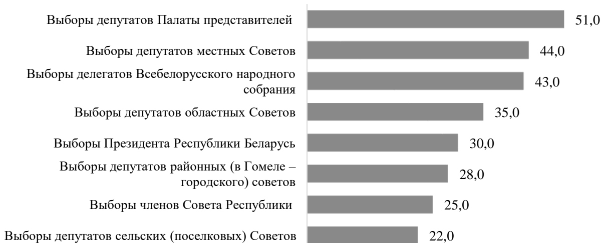
Рисунок 1. Распределение ответов на вопрос «Как Вы считаете, что будет происходить в Единый День голосования 25 февраля 2024 года?», в %

Результаты социологических исследований [1; 2; 3; 4] свидетельствуют о том, что в коллективистской, социоцентрической культуре, к которой принадлежат белорусы, более действенным и чаще реализуемым в социальных отношениях является алгоритм взаимной доверительности. Доверие либо недоверие к субъектам электоральной кампании – важный фактор, регулирующий электоральные намерения и поведение белорусов. Жители Республики Беларусь доверяют власти [5] и уже привычно ждут инициативы от органов власти и общественных организаций в объяснении сути происходящей сегодня трансформаций политической системы. Эту гипотезу косвенно подтверждают данные, представленные на рисунке 2.