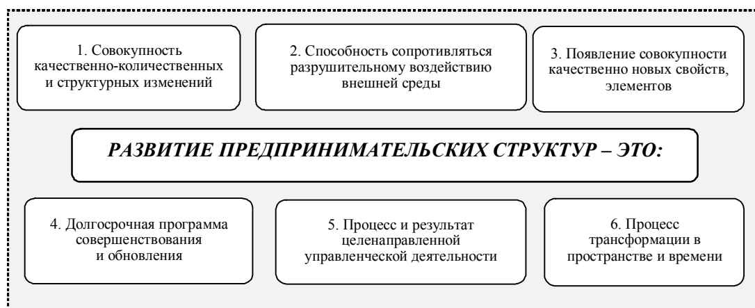
Рис. 1. Верификация понятия «развитие предпринимательских структур» Примечание. Обобщено и систематизировано автором по источникам [1–8].

Исследование существующих точек зрения относительно понимания сущности развития предпринимательских структур позволило выделить следующие теоретические подходы, представленные на рис. 1.