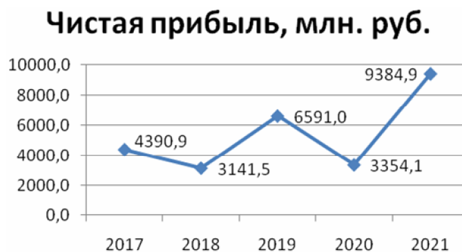
Рис. 1. Чистая прибыль, млн руб. [2]

Если результат отрицателен, его принято называть убытком.