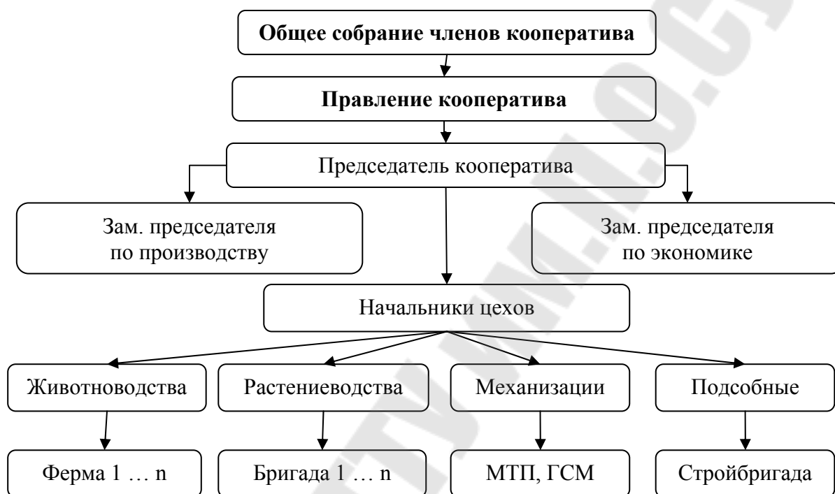
Рис. 3 Отраслевая структура управления производственным кооперативом

Отраслевая структура управления получила распространение в специализированных кооперативах. В них создаются крупные цехи по производству отдельных видов продукции или выполнению отдельных видов работ. Цех возглавляют главные специалисты: главный агроном, главный зоотехник и т.д. (рисунок 3).