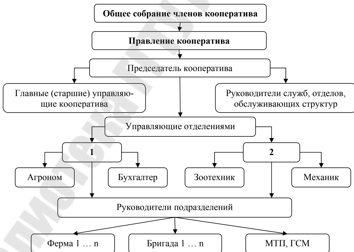
Рис. 2 Территориальная (трехступенчатая) структура управления производственным кооперативом.