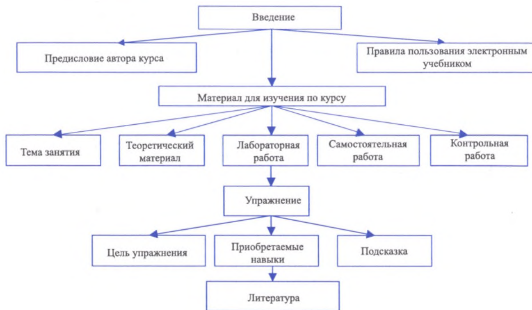
Рис. 1. Структура электронного учебника

Здесь реализуется видение автором содержания и структуры курса, его методических принципов и приемов. Авторское представление о курсе отражает и пользовательский интерфейс – визуальное представление материала и приемы организации доступа к информации разного уровня. В результате объединения предметного материала и пользовательского интерфейса с помощью соответствующего инструментального средства программирования создаются программные модули, с которыми и предстоит работать студенту [4].