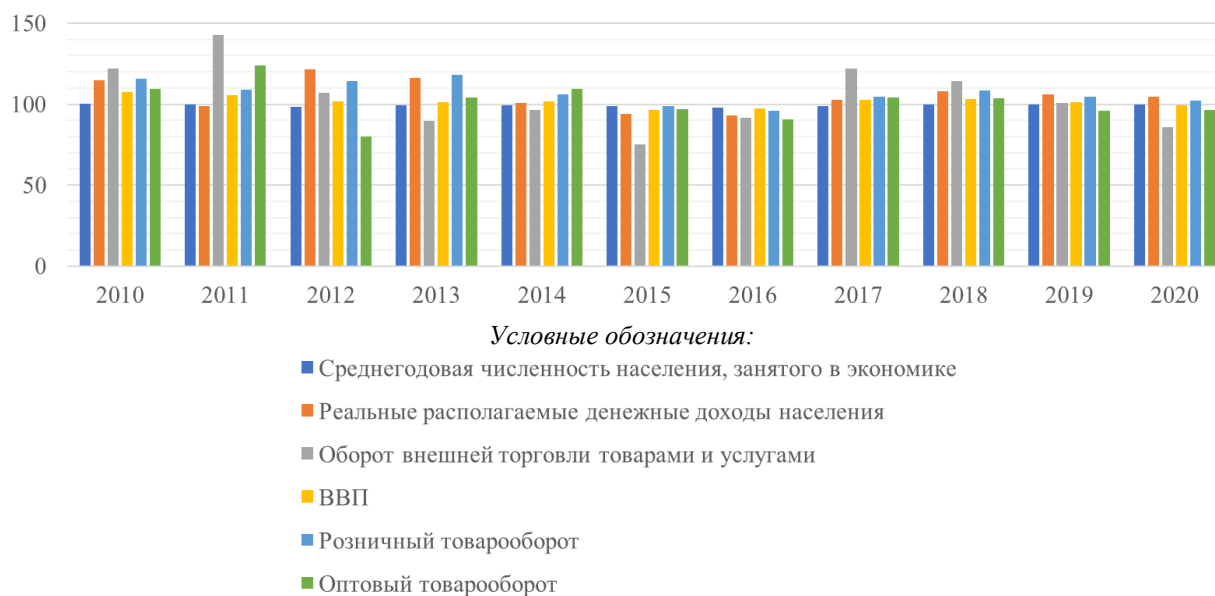
Рисунок 2 – Индексы основных социально-экономических показателей (в % к предыдущему году)

Примечание – Разработано автором на основании данных Национального статистического комитета Республики Беларусь [1–3].