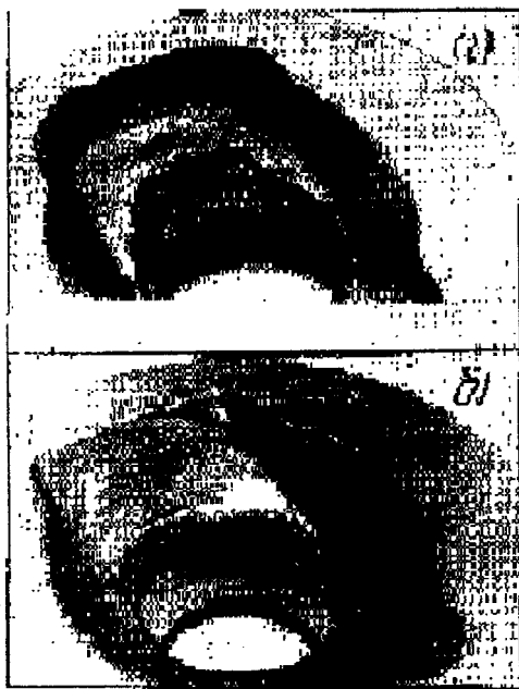
Рис. 1 Характер разрушения холодно-высадочных матриц с радиусом сопряжения а) 2 мм; б) 5 мм

Исследовали влияние на напряженно-деформированное состояние радиуса сопряжения формообразующих поверхностей матриц третьего перехода для холодной высадки железнодорожного болта М22х70. Оценка