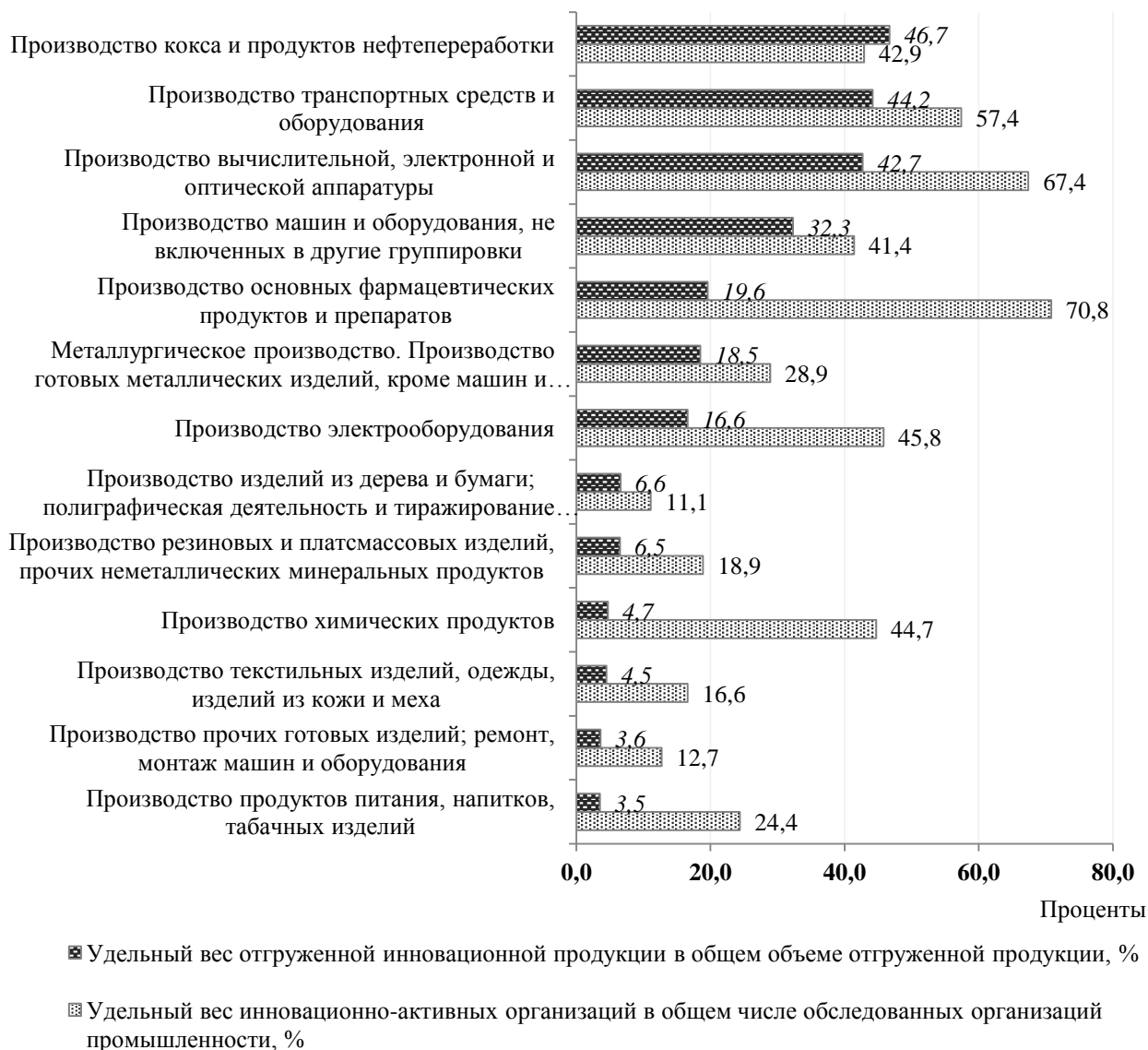
Рисунок 2 – Значения показателей инновационной активности промышленных предприятий Республики Беларусь в 2019 г. в разрезе видов экономической деятельности, %