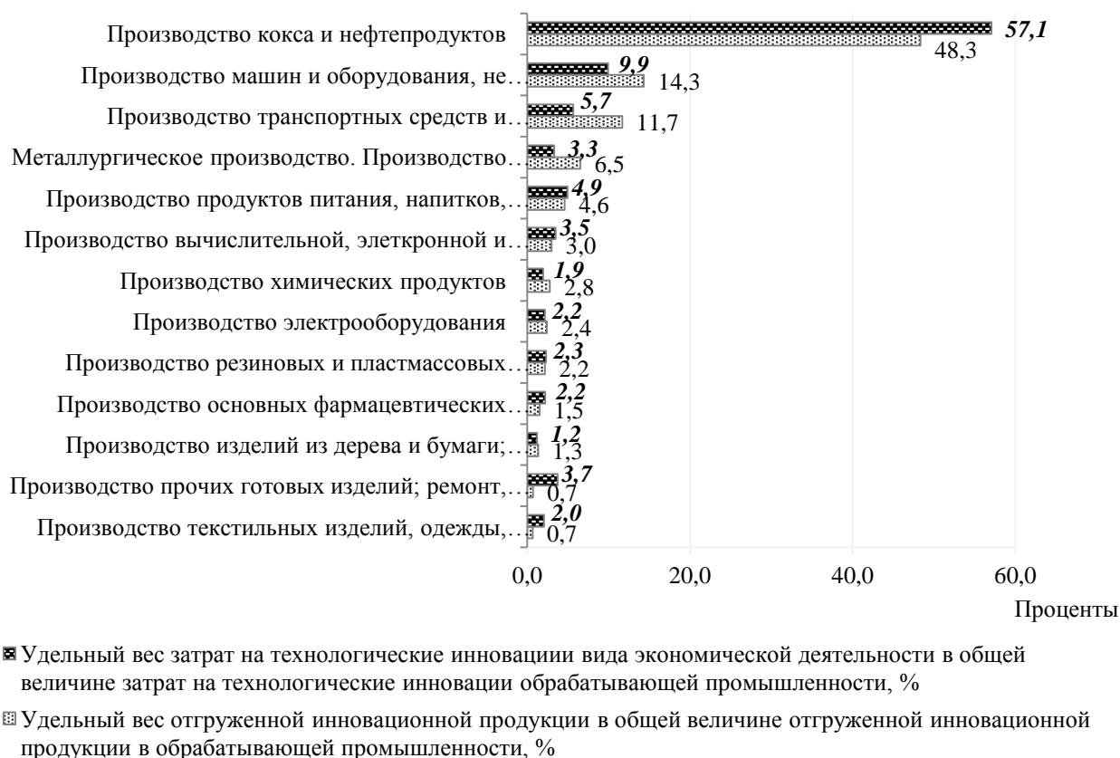
Рисунок 3 – Распределение затрат на технологические инновации и величины отгруженной инновационной продукции по видам экономической деятельности обрабатывающей промышленности Республики Беларусь в 2019 г., %

Существенный интерес представляет также отраслевое распределение затрат на технологические инновации и величины отгруженной инновационной продукции в обрабатывающей промышленности (рис. 3).