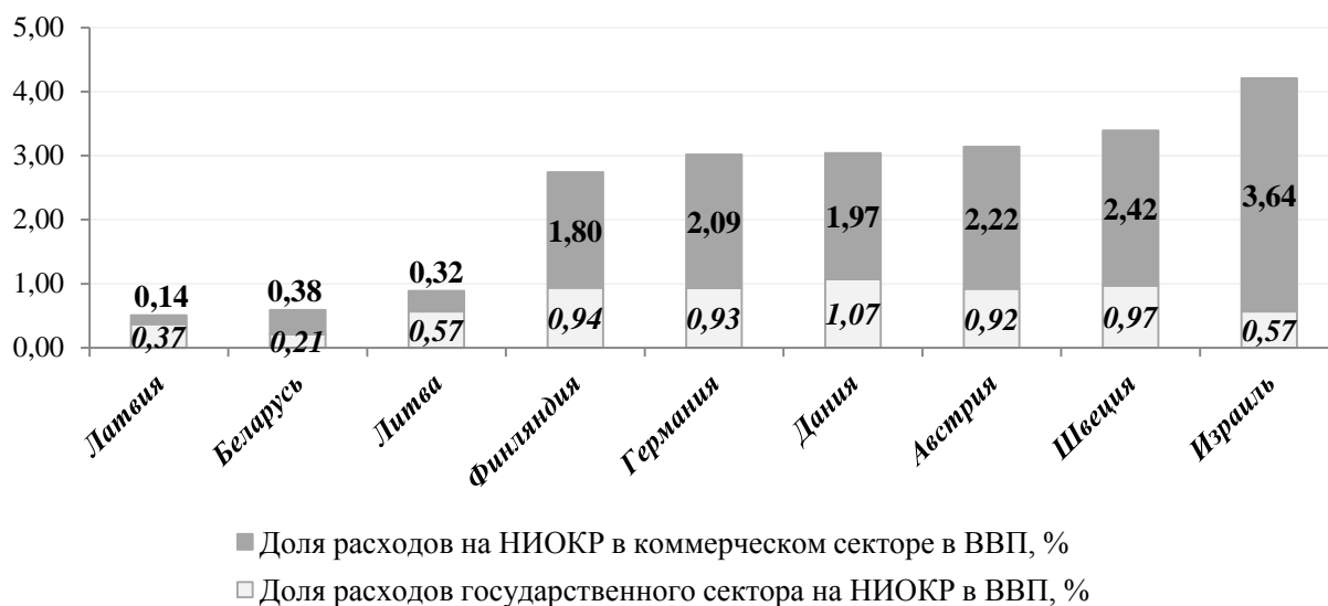
Рисунок 4 – Финансирование НИОКР в коммерческом и государственном секторе, % к ВВП