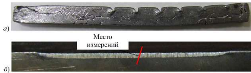
Рис. 2 - Отпечатки кромки ножа ( а ) и зона измерений ( б )

По результатам испытаний проводят определение физического износа ножа (путем измерения его ширины), а также скругление его режущей кромки (путем получения отпечатка его кромки на мягком металле (свинец) (рис. 2, а ). Измерения проводят в середине поврежденного участка каждого ножа (рис. 2, б ) с использованием специального приспособления. После получения отпечатков на конфокальном лазерном микроскопе Olympus LEXT OLS3000 получают точные значения радиуса закругления.