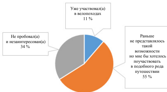
Рис. 2. Опыт в роли велотуриста

По результатам опроса выяснилось, что наиболее удобными разновидностями велотуризма белорусы находят однодневные велопоходы и велопоходы выходного дня (походы с одной ночевкой). А среди видов велосипедного туризма наибольший интерес вызвали классический велотуризм и познавательные велопоходы, лишь 10,7 % опрошенных не считают ни один из предложенных вариантов интересным (рис. 3).