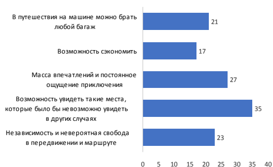
Рис. 2. Преимущества автотуризма