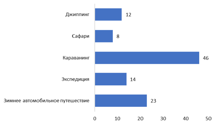
Рис. 1. Предпочтение видов автотуризма

Большинство людей в этом опросе предпочли караванинг. И это вполне очевидно, так как этот вид пользуется популярностью за пределами территории Беларуси. При этом в Беларуси развитие караванинга находится на стадии становления. Основная проблема – в стране нет специально оборудованных площадок, где можно было бы поставить этот транспорт. Ведь для того, чтобы жить посреди леса или на берегу озера в доме на колесах, нужна парковка, к которой подведены вода, электричество. В Польше таких мест более трех сотен, в Беларуси – единицы.