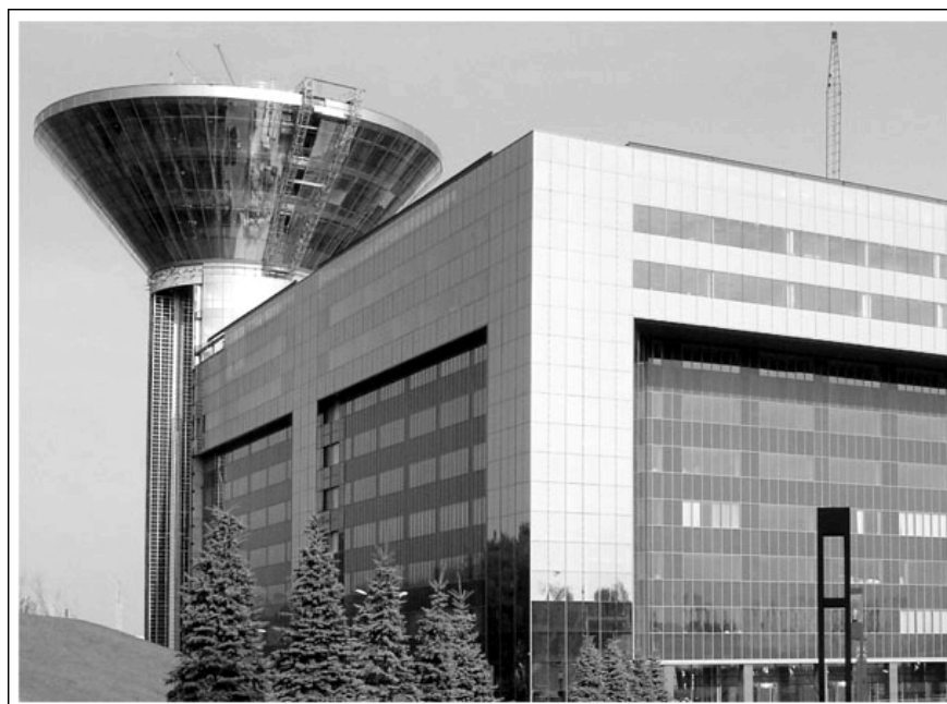
Рис. 3. Административный офисный центр правительства Московской области

Стекла с низкой эмиссией выпускаются ведущими мировыми компаниями «AGC flat glass» (Япония), «Pilkington» (Англия), «Saint-Gobain» (Франция), «Guardian» (США). Пример использования низкоэмиссионных стекол компании AGC Flat Glass Europe при остеклении здания представлен на рис. 3.