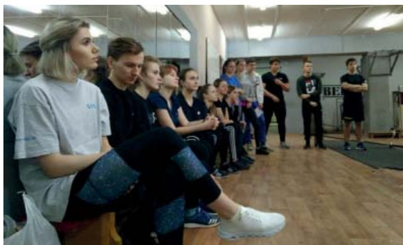
Спортивный клуб, кафедра «Физическое воспитание и спорт»