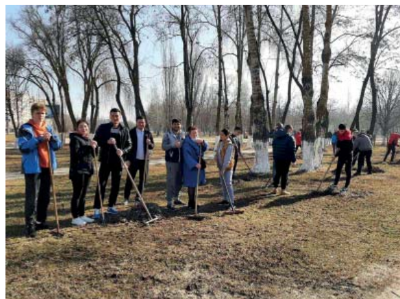
Отдел воспитательной работы с молодежью

В наведении порядка на прилегающей к университету территории приняли участие студенты и представители всех факультетов университета.