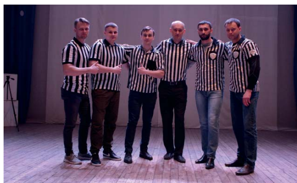
Спортивный клуб, кафедра «Физическое воспитание и спорт»