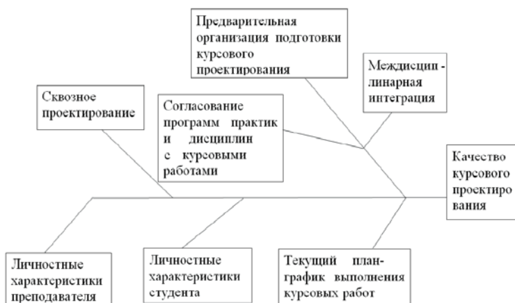
Рис. 2. Диаграмма Искавы праблема «Качество курсового проектирования»