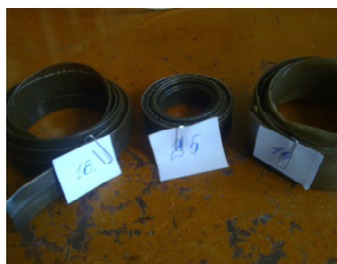
Рис. 2. Опытные образцы полимерной ленты с различным содержанием антипирена

Методика определения параметров горючести (воспламеняемости). Установление группы трудногорючих и горючих твердых веществ и материалов осуществляли по методу их экспериментального определения согласно [4].