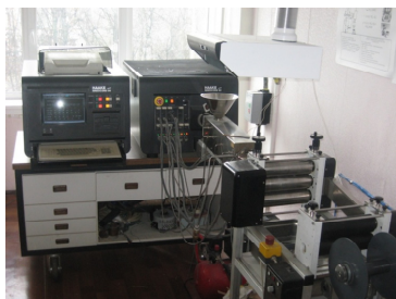
Рис. 1. Компьютеризированный экструзиограф «Rheocord 90» фирмы «НААКЕ»

Методики и материалы. Методика получения полимерных образцов. Выбор полимеров и антипирена обусловлен неорганической природой, низкой токсичностью с классом алюмосиликатов. С целью получения композиционных материалов в полимерную матрицу на стадии загрузки полимера в компьютеризированный экструзиограф (рис. 1) вводились различные навески антипирена разработанного состава. Была получена полимерная лента (рис. 2) [3].