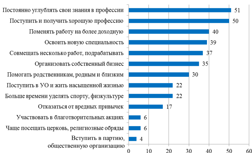
Рис. 4. Иерархия позитивных инструментальных ценностных установок студенческой молодежи Гомельской области (вариант ответа: буду обязательно – для достижения цели)

В рейтинге способов достижения цели (рис. 4), которые студенческая молодежь будет предпринимать в первую очередь, ведущие места занимают виды деятельности, направленные на повышение уровня образования. Более половины молодых людей ради достижения своих целей готовы поступить в вуз, техникум и получить хорошую профессию, постоянно углублять свои знания в выбранной профессии, освоить новую специальность. Вторые по значимости места занимают виды деятельности, связанные с изменением трудовой активности («поменять работу на более доходную», «совмещать несколько работ, подрабатывать»).