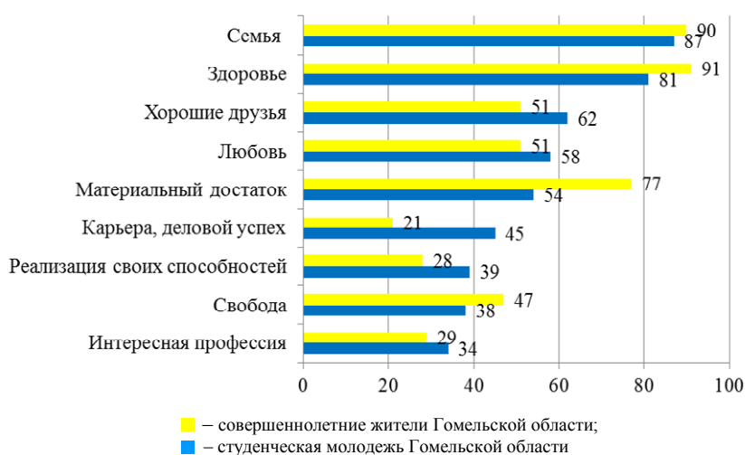
Рис. 1. Ранжированная модель ценностных ориентаций белорусов в целом и студенческой молодежи

В анкете был представлен сформированный перечень из 18 ценностей, каждую из которых респонденты должны были определить как положительную, отрицательную или нейтральную. Полученные результаты позволили выстроить ранжированную модель ценностных ориентаций (рис. 1).