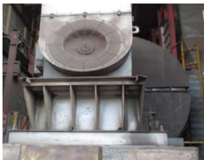
Рисунок 1 – Внешний вид высоковольтного асинхронного двигателя мощностью 1,6 МВт, эксплуатируемого в системе пылегазоудаления электросталеплавильного цеха № 2

Контроль состояния эксплуатируемых электродвигателей осуществляется вибрационным методом один раз в квартал во время планово-принудительных ремонтов (рисунок 2). Внеплановая диагностика производится сразу после проведения ремонтных работ при замене какого-либо узла электродвигателя. Критерием оценки служат границы зон вибрационного состояния для электромашин 1-й группы. Из рисунка 2 виден неравномерный характер временных промежутков между проведёнными ремонтными работами над электродвигателем ПГУ-3. Пиковое значение между 10.01.2006 – 15.01.2007 обусловлено полной остановкой производства на данном участке и не учитывалось при дальнейших расчётах. Также в связи с непрерывным характером металлургического производства БМЗ в некоторые промежутки времени возможность проводить плановые ремонтные работы отсутствует до появления окна в работе основного технологического оборудования.