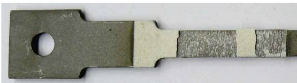
Рис. 2. Фрагмент образца с металлокерамическим покрытием после испытаний на растяжение

К качестве примера приведены испытания на растяжение двухслойных покрытий, плазменно-напыленных на плоские металлические образцы, которые были изготовлены в соответствии с ГОСТ 1497–84. Для материала основы использовали листовую сталь 08Х18Н10 толщиной 2 мм. Подслой толщиной 100 мкм напыляли с помощью порошка \text{Co-32\%Ni-21\%Cr-8\%Al-0,5\%Y} (дисперсностью – 75 + 45 мкм). Для напыления внешнего керамического покрытия (толщиной 200 и 400 мкм) использовали порошок \text{ZrO}_2\text{-8\%Y}_2\text{O}_3 (дисперсностью – 125 + 45 мкм). На рис. 2 показан образец с растрескавшимся и частично отслоившимся металлокерамическим покрытием.