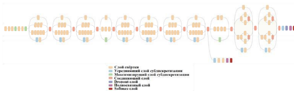
Рис. 4. Архитектура сети Inception v3

Для решения поставленной задачи была взята предобученная сеть Inception v3 . Архитектура сети Inception v3 (рис. 4) способна решать похожие задачи классификации. Inception v3 отработала с лучшими результатами точности классификации на соревновании ImageNet 2015 и хорошо подходит для распознавания объектов. Отличительной особенностью данной архитектуры являются изменения размера ядра свертки с 5 \times 5 на 3 \times 3 и перестроение комбинации сверточных слоев. Для настройки работы сети под поставленную задачу ее необходимо дополнить слоем, который содержит 4 нейрона, соответствующих 4-м классам классификации.