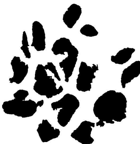
Рис. 3. Результат выделения контуров

После выполнения алгоритма поиска контуров с помощью цепного ключа Фримена получается следующий результат (рис. 3).