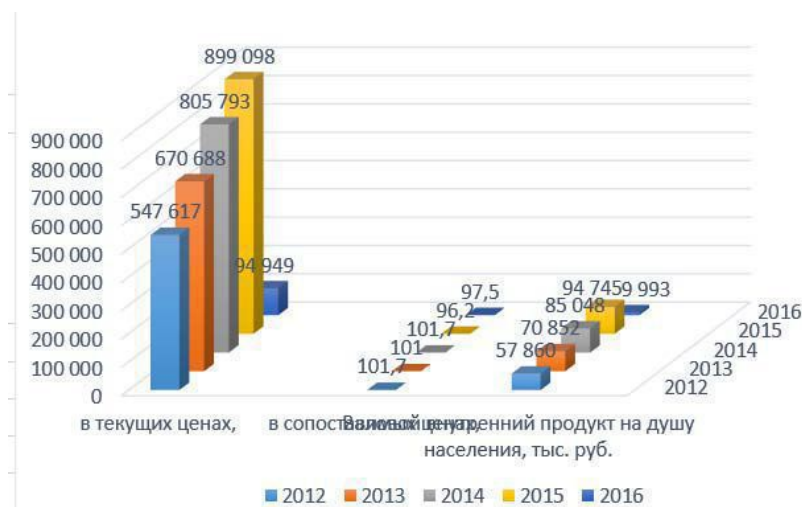
Рис. 2. Динамика ВВП Республики Беларусь 2012–2016 гг.

Для анализа влияния инфляции на экономическое состояние страны необходимо сравнить темпы инфляции и роста ВВП. На протяжении последнего десятилетия темпы инфляции в стране, в основном, превышали темпы роста ВВП, что отрицательно влияло на качество экономического роста и являлось источником рисков макроэкономической нестабильности. По мнению многих экспертов, правительству необходимо сделать выбор: либо поддержание высоких темпов экономического роста и увеличение инфляционного потенциала, либо сдерживание инфляции и очень умеренный экономический рост [4].