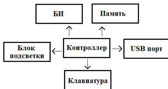
Рис. 1. Функциональная схема организации многофункциональной операторской панели с графическим дисплеем и энергоэффективной подсветкой органов управления

Функциональная схема организации многофункциональной операторской панели с графическим дисплеем и энергоэффективной подсветкой органов управления представлена на рис. 1.