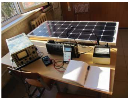
Рис. 1. Исследуемый лабораторный стенд