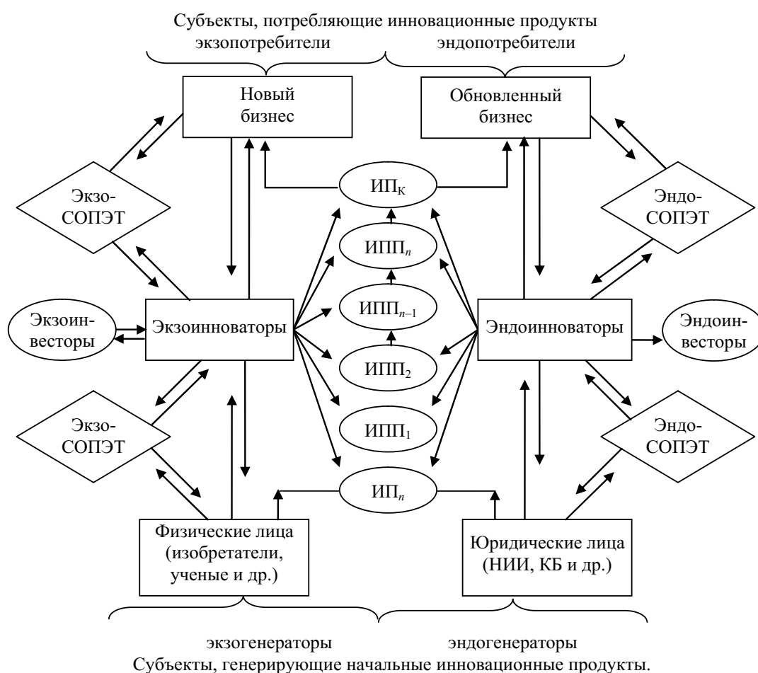
Рис. 2. Модель идентификации инновационного процесса, его основных параметров и участников: ИПН, ИПК – инновационный продукт начальный и конечный; ИПП 1 ...ИПП n – инновационные полупродукты по этапам НИОКР от 1 до n; СОПЭТ – субъекты, обеспечивающие переработку, экспертизу и трансферт инновационных и интеллектуальных продуктов

Элементами НИС являются инновационный процесс, имеющий собственную структуру, продукты, полупродукты и исходный сырьевой продукт, а также субъекты инновационной деятельности. Имеет смысл модель управления НИС, изображенную на рис. 1, представить более детально (рис. 2). С учетом обозначенных взаимосвязей представим основных субъектов, отображенных на модели идентификации инновационного процесса, его основных параметров и участников.