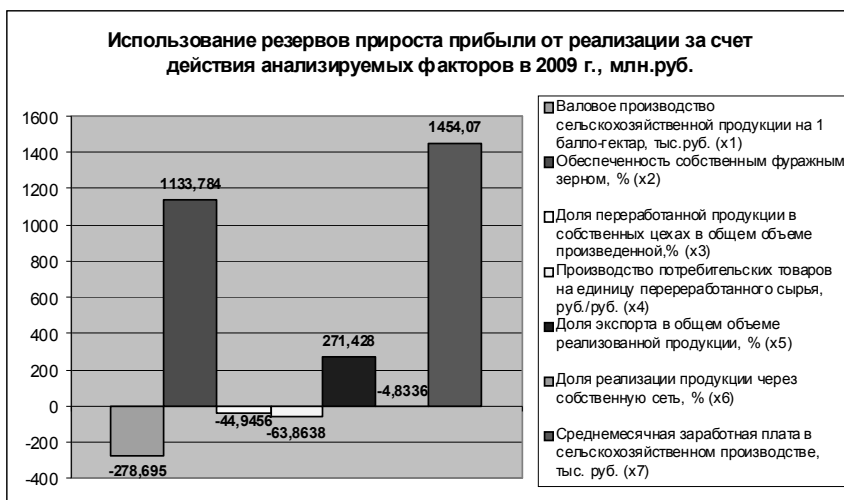
Рисунок 2 - Использование резервов прироста прибыли от реализации продукции за счет действия интеграционных факторов*

- в 2009 г. совокупное использование существующих резервов прироста прибыли от реализации продукции за счет действия интеграционных факторов составило 4,67% или 2467 млн. руб., в т. ч. за счет повышения уровня обеспеченности собственным фуражным зерном - 2,14% или 1133,784 млн. руб.; роста объемов экспорта произведенной продукции - 0,51% или 271,428 млн. руб.; роста среднемесячной заработной платы в сельскохозяйственном производстве - использование резерва на 2,75% или 1454,07 млн. руб. (рис. 2);