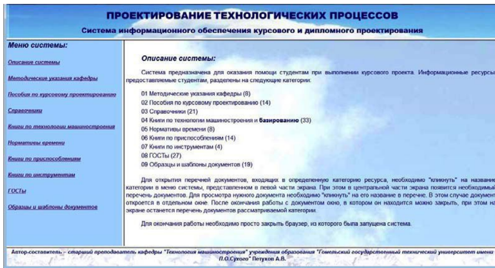
Рис. 1. Вид главной страницы СИО КП