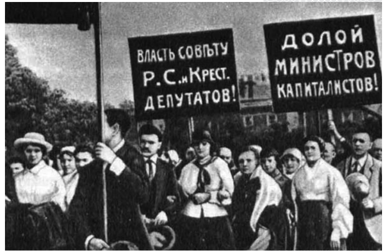
▲ Жители Петрограда на политической демонстрации в июне 1917 года

Однако после завоевания власти большевики очень скоро убедились, что полноценное участие масс в управлении государством невозможно по причине их неграмотности, управленческой некомпетентности и склонности к митинговой активности.