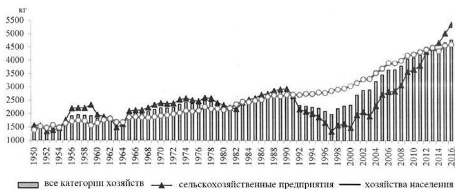
Рис. 2. Продуктивность коров в сельском хозяйстве

Периоды наращивания и сокращения поголовья коров определили изменения в средствах производства. Продуктивное использование этих средств и внедрение в производство достижений научно-технологического прогресса обеспечило повышение уровня продуктивности животных. Если в 1950 г. удой на корову составлял 1418,7 кг, в 1963 г. – 1564,0 кг, в 1970 г. – 2214,1 кг, в 1980 г. – 2272,8 кг, в 1999 г. – 2287,7 кг, то в 2016 г. достиг 4794,2 кг (рис. 2).