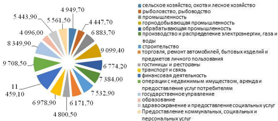
Рис. 1. Средняя заработная плата по видам экономической деятельности [1]

1. Профессия преподавателя не является престижной и высокооплачиваемой, поэтому зачастую в учебные учреждения берут человека, который хоть немного соответствует минимальным критериям для этой должности. Для сравнения рассмотрим номинальную заработную плату в других сферах экономической деятельности (рис. 1).