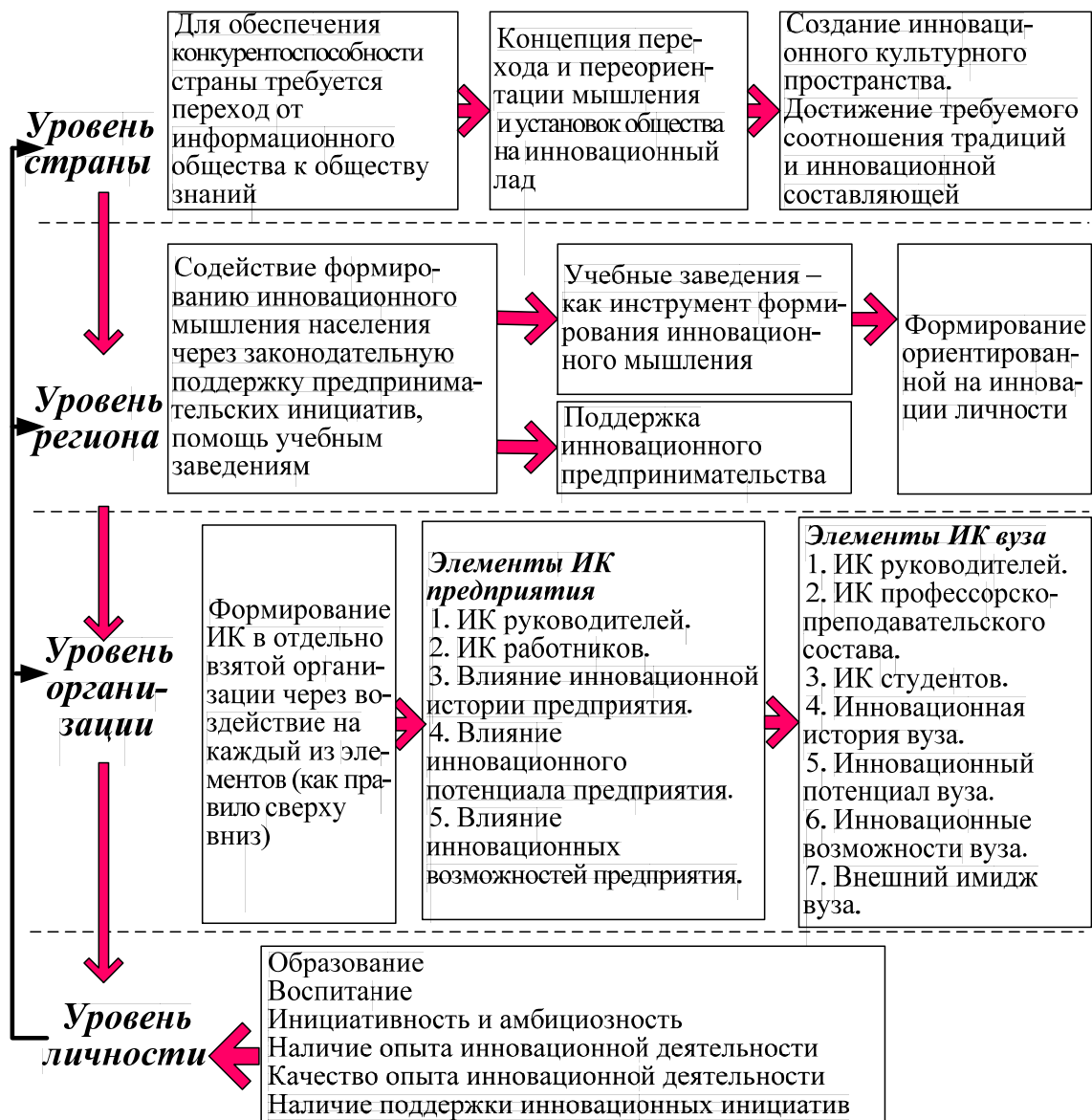
Рис. 1. Пути повышения инновационной культуры в стране

На результативность инновационной деятельности влияют множество факторов. Основными факторами, определяющими конечный результат инновационной деятельности, в рамках страны являются [2]: