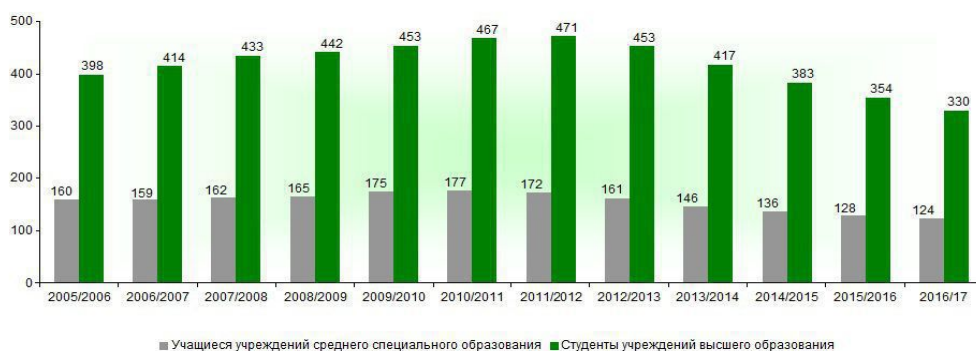
Рис. 1. Численность обучающихся в учреждениях среднего специального и высшего образования на 10000 человек населения [5]

Анализ данных Национального статистического комитета Республики Беларусь показывает, что число высших учебных заведений в Беларуси за последние 10 лет остается практически неизменным – около 54 учреждений, а число учащихся в них уменьшается как в абсолютном показателе, так и относительно общего населения в стране. Так, в 2016/2017 учебном году количество студентов сократилось на 23,2 тыс. человек по сравнению с предыдущим годом. На рис. 1 видно, что в стране значительно больше студентов высших учебных заведений, чем средних специальных.