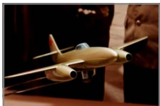
Фото с открытия выставки Ирины ЧЕРНЯВСКОЙ