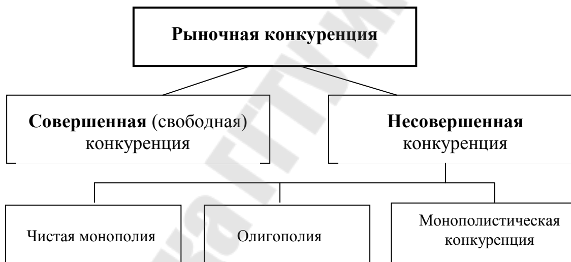
Рис 2. Основные типы рыночной конкуренции

В экономической теории принято выделять два типа конкуренции – совершенную и несовершенную. Каждому типу конкуренции соответствует особое состояние рынка (модель рынка), особая рыночная структура. Рыночная структура выступает как совокупность признаков, отражающих способ установления цены и объема выпуска, а также характер взаимодействия хозяйствующих субъектов. Рыночная структура определяется следующими базовыми признаками: 1) количество субъектов рынка и их рыночные доли объема продаж; 2) условия вступления в отрасль и выхода из нее; 3) степень контроля цены со стороны производителей; 4) уровень дифференциации продукта; 5) характер экономического поведения экономических субъектов.