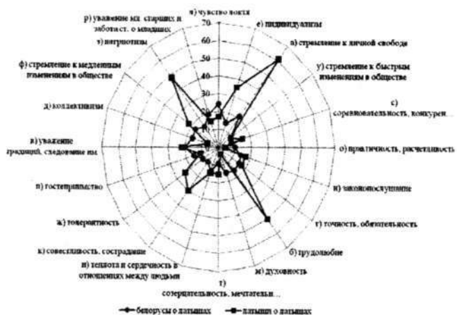
Рис. 4 Белорусы о латышах и латыши о латышах

Следует отметить, что в исследовании зафиксировано существенное различие в самооценке ментального портрета латышей и их как восточных (русских), так и западных (поляков) соседей.