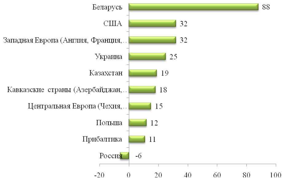
Рис. 2. Рейтинг стран по сумме положительных и отрицательных оценок влияния фактора «отношение местного населения, гарантии их безопасности» на желание искать работу в данной стране (по результатам опроса иностранной студенческой молодежи Гомельской области в 2013 г.), %

Не подтвердились гипотезы о том, что выбор Беларуси в качестве страны для получения высшего образования осуществлялся потому, что здесь легко учиться. Разница в культуре обучения, быта, правилах поведения и общения, вместе с необходимостью освоения русского языка, усложняет получение высшего образования для иностранцев.